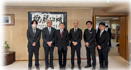
【静岡県塚本副知事】