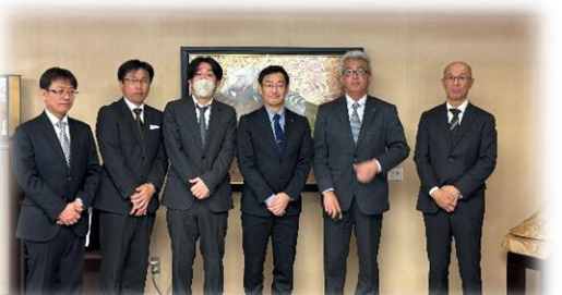
【静岡県平木副知事】