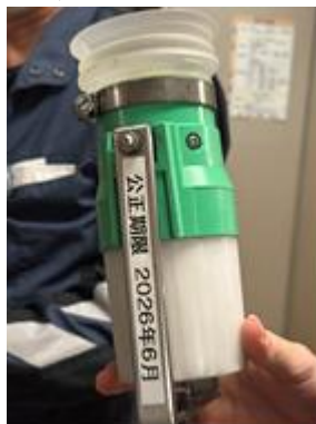
【点検機器の校正の確認】