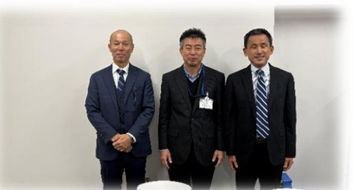
【浜松市中央図書館】