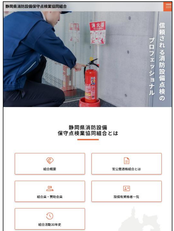
【新 HP のトップページ】