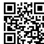
【新 HP の QR コード】

なお、当面は旧メールアドレスでも送受信は可能ですが、今後は時期を見て切り替えていきます。